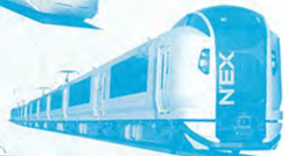
成田エクスプレス