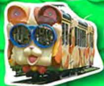
パノラマボード シール8シート