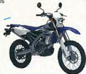
オフロードバイク