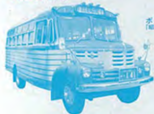
ポンネットバス [船橋ロマン号]豊後高田市