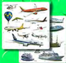
パノラマボード 2ばめん