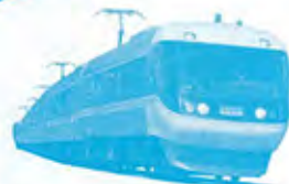
ワイドビューしなの