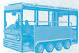
コミュニティバス