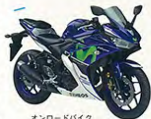
オンロードバイク