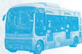
コミュニティバス