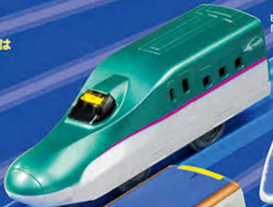
E6系新幹線 「はやぶさ」