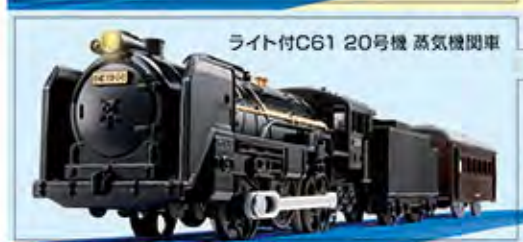
ライト付C61 20号機 蒸気機関車