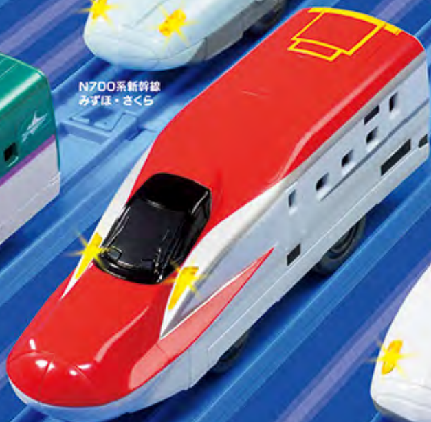
E6系新幹線 スーパーこまち