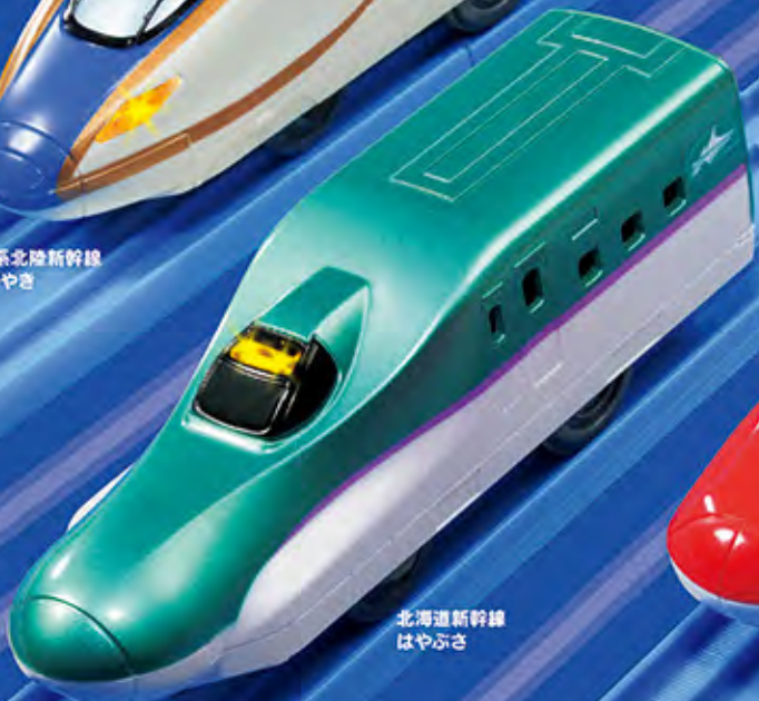
北海道新幹線 はやぶさ