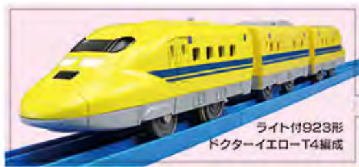
ライト付923形 ドクターイエロー-T4編成