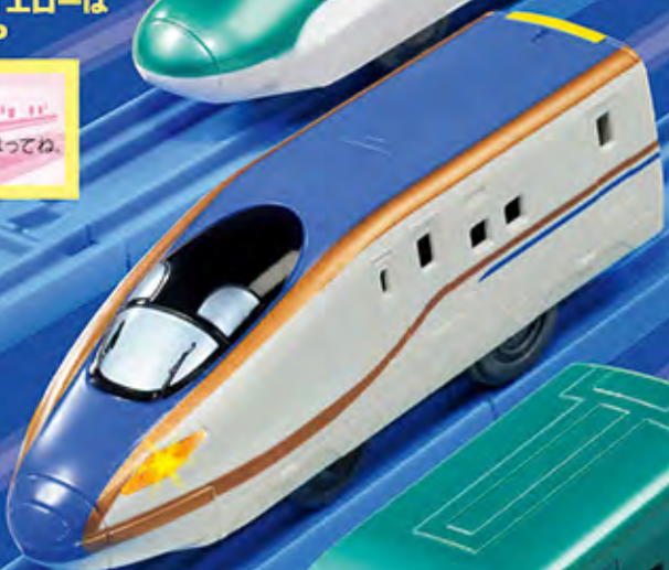
E7系北陸新幹線 かがやき